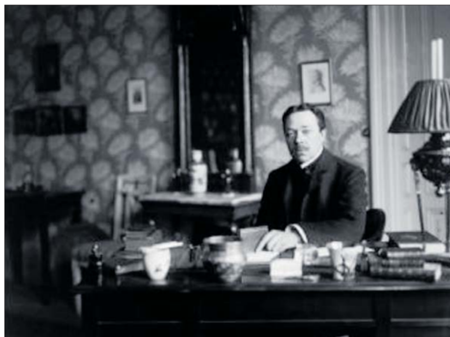
El escritor Ford Madox Ford.

En resumen, Juan Villoro sigue siendo una grata fuente de sorpresas, capaz de introducir la sutileza y la sonrisa en cualquier asunto que aborde, por escabroso que parezca.