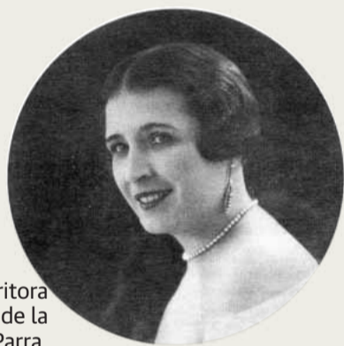
La escritora Teresa de la Parra.

de uno de esos textos que estaban inéditos en el mercado español. Se trata de 'Diario de una caraqueña por el Lejano Oriente', de Teresa de la Parra. El libro, que la editorial Menoscuarto publica en su colección Entretanto, no solo nos proporciona una deliciosa lectura, muy apropiada por cierto para estas fechas veraniegas (otra cuestión que ahora parece ineludible) sino que nos abre la puerta al recuerdo o